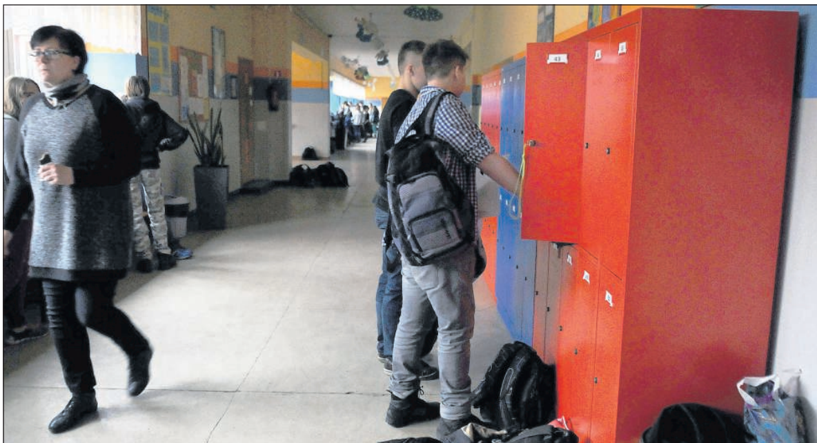
Mieszkańcy zaakceptowali wszystkie trzy projekty Zespołu Szkół nr 14 w Toruniu zgłoszone do budżetu partycypacyjnego. Między innymi w szkole pojawią się nowe szafki dla uczniów

Z kolei na terenach zielonych między ulicami Prüfferów, Iwanowskiej, Jasną oraz Hallera zostanie urządzony minipark z nowoczesnym placem zabaw dla dzieci z bezpieczną nawierzchnią i wybiegiem dla psów. Koszt - blisko 146 tys. zł. Kolejne przedsięwzięcie to rekonstrukcja placu zabaw dla dzieci przy ul. Szubińskiej. W ramach projektu powstanie ogrodzony plac zabaw ze sztuczną, bezpieczną