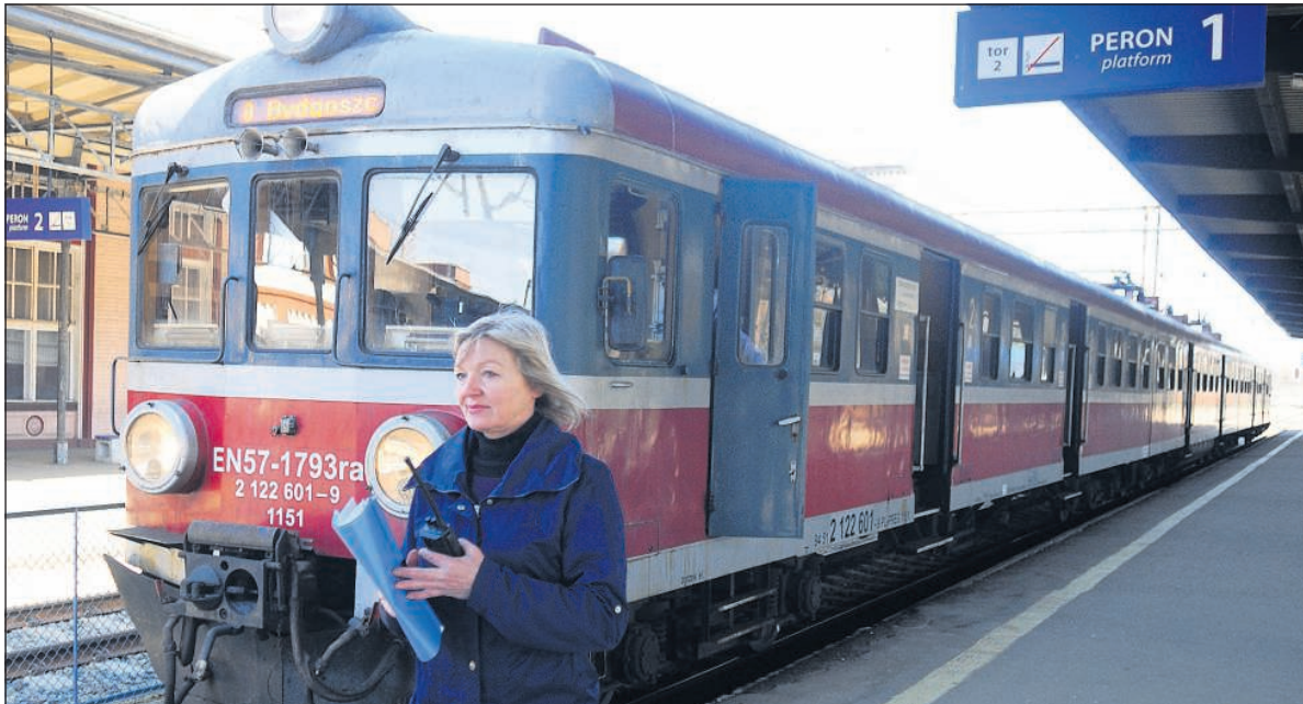
Pociągi między Toruniem a Bydgoszczą jeżdżą w 40-45 minut. Na zdjęciu skład Przewozów Regionalnych

Od 9 marca, po rewitalizacji linii kolejowej, pociągi na trasie Toruń - Bydgoszcz jadą szybciej niż poprzednio. Obecnie, w przypadku pociągów osobowych jest to 40-45 minut, przed remontem czas podróży wynosił ok. 70 minut. Trwają jeszcze prace przy wiadukcie przy placu Armii Krajowej w Toruniu, po ich zakończeniu nastąpi kolejna korekta rozkładu jazdy i skrócenie czasu podróży. Prowadzona jest rewitalizacja dworców i przystanków kolejowych. Miasto Toruń przejęło dworzec Toruń Główny. Po remon-