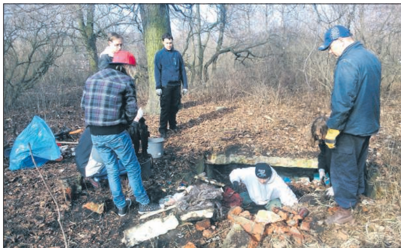
Prace na cmentarzu przy ul. Poznańskiej idą pełną parą