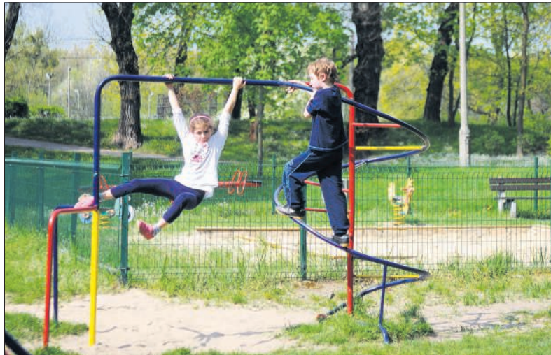
Wiele placów zabaw na lewobrzeżu wciąż wymaga modernizacji. Jeden z nich znajduje się w Parku 1000-lecia