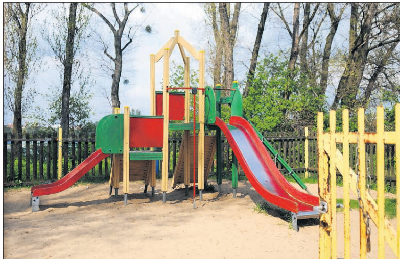
W nieco lepszym stanie jest teren rekreacyjny dla dzieci przy ul. Poznańskiej 52, ale i ten doczeka się drobnej kosmetyki