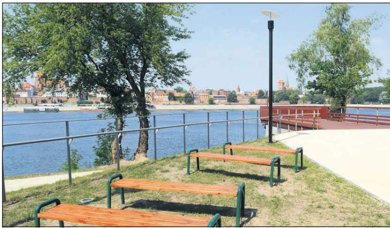
Kępa Bazarowa - jeden z terenów zielonych w Toruniu

► 10 maja - dwa równoległe spaceru na lewobrzeżu, pierwszy dotrze na Kępę Bazarową (zbiórka o godz. 11 w punkcie widokowym przy ul. Majdany - o 10.30 i 11 można tam dopłynąć bezpłatną „Katarzynką” z Bulwaru Filadelfijskiego), drugi - w Parku Tysiąclecia, zbiórka o 11 przed Aquaparkiem przy ul. Hallera 79; spaceru zakończą się piknikiem na campingu Tramp przy ul. Kujawskiej 14 o godz. 13.