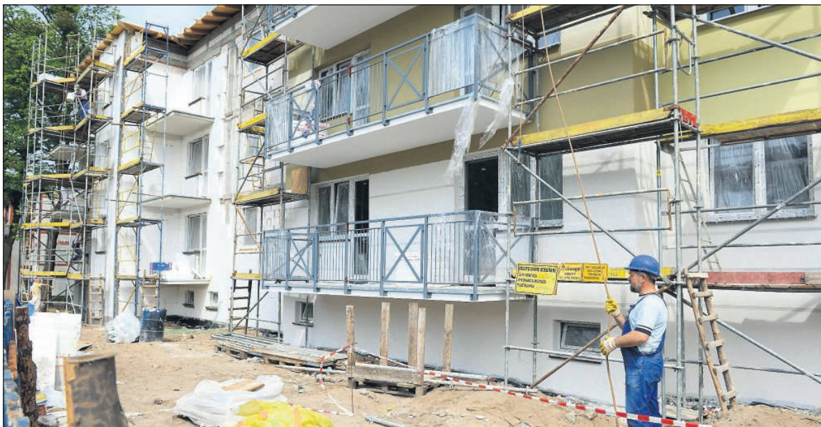
Budowa bloków komunalnych na ulicy Armii Ludowej

► Dzięki takiemu rozwiązaniu miasto ogranicza nakłady inwestycyjne, a firmy prywatne otrzymują korzyści komercyjne.