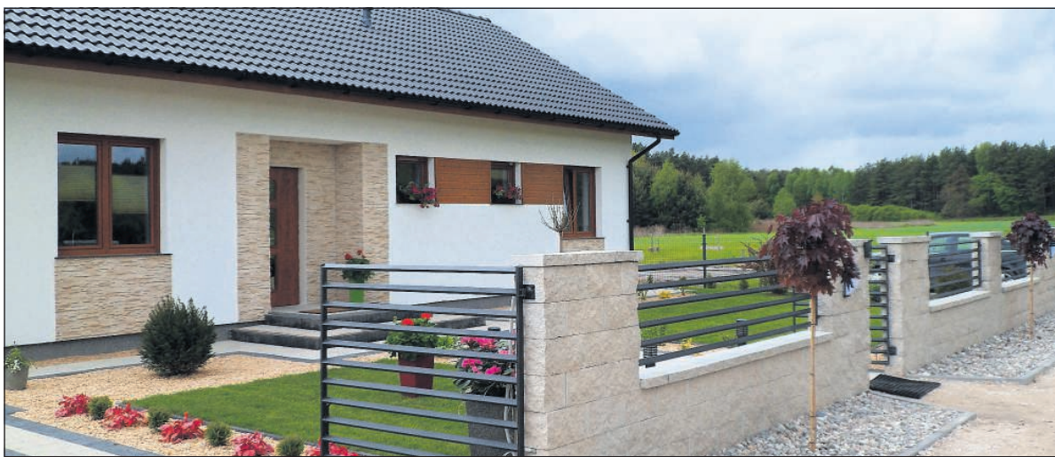
Podczas pikniku rodzinnego można było zwiedzać pokazowy dom

Podczas kwietniowych Targów Budownictwa i Nieruchomości „Mieszkaj Lepiej”, zorganizowanych przez „Nowości”, zainteresowani klienci otrzymali zaproszenia do Czarnych Błot na Dni Otwarte, podczas których można było zwiedzić teren inwestycji i zobaczyć pokaz tynkowania agregatem. Każdy gość wyszedł z upominkami