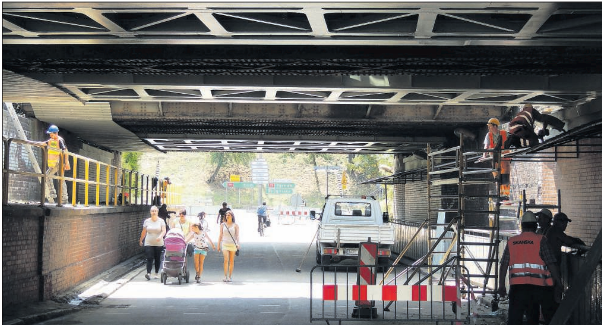
Od wczoraj wiadukt przy placu Armii Krajowej jest już otwarty dla kierowców i pieszych

Udostępnienie wiaduktu dla ruchu samochodowego i pieszego nie oznacza jednak zakończenia wszystkich przewidzianych w tym zadaniu prac. Do wykonania pozo-